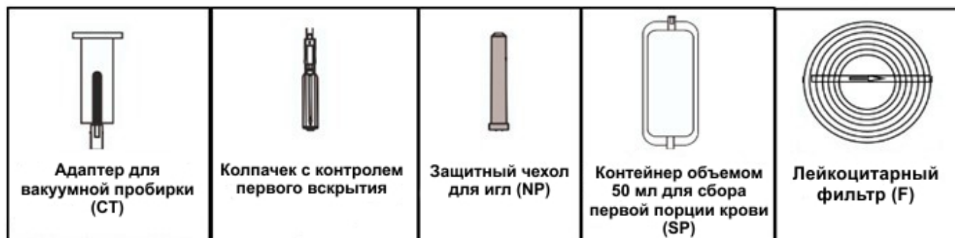
Рис. 1 КОМПОНЕНТЫ СИСТЕМЫ